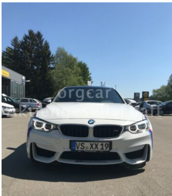
don't buy a car before you try us!