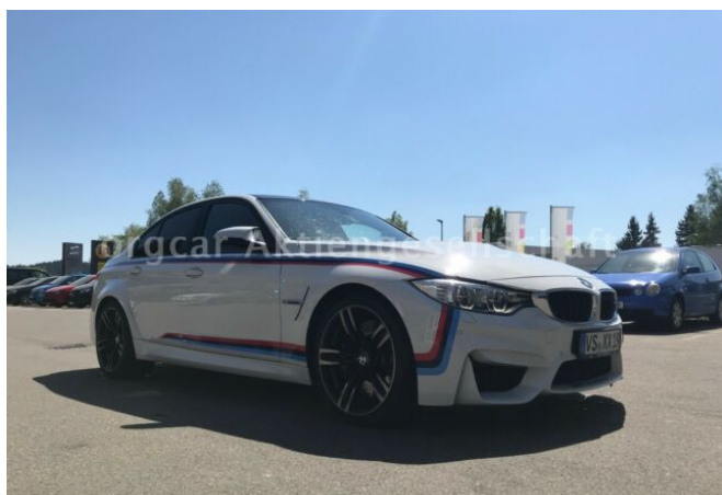
don't buy a car before you try us!