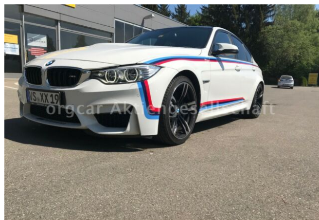
don't buy a car before you try us!