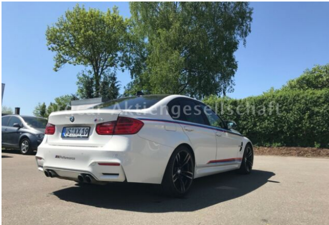
don't buy a car before you try us!