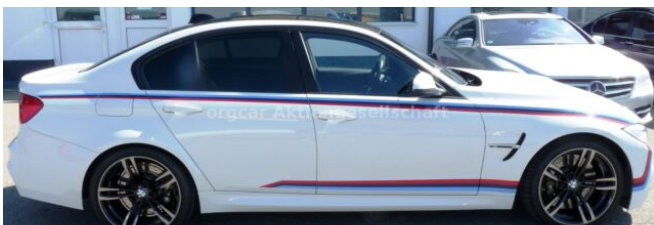
don't buy a car before you try us!