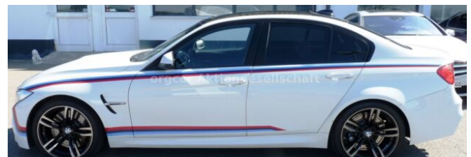
don't buy a car before you try us!