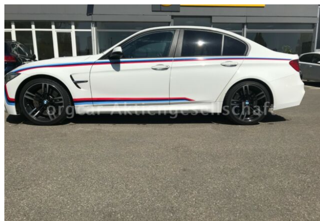
don't buy a car before you try us!