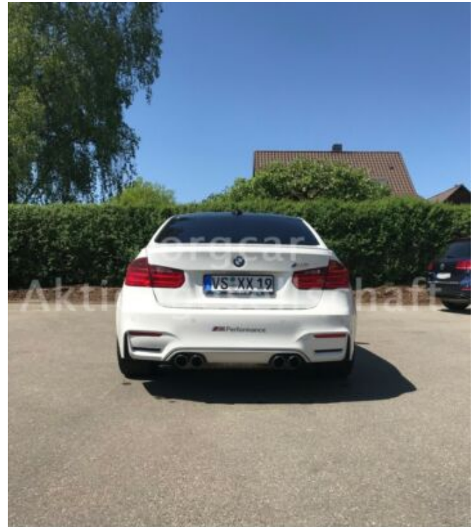
don't buy a car before you try us!