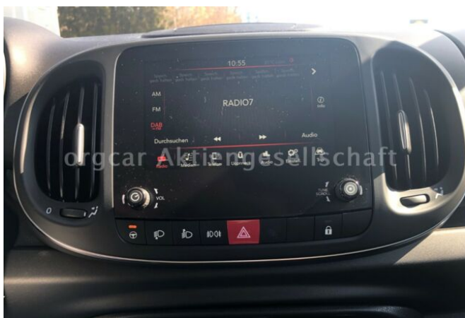
don't buy a car before you try us!