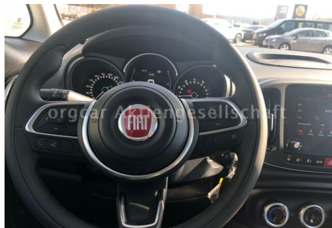
don't buy a car before you try us!