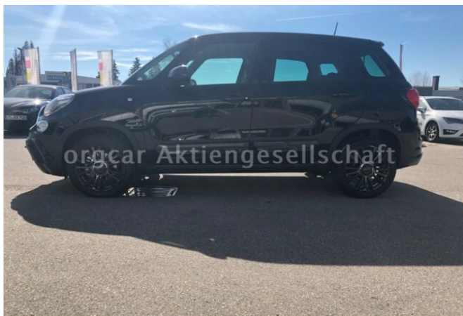
don't buy a car before you try us!