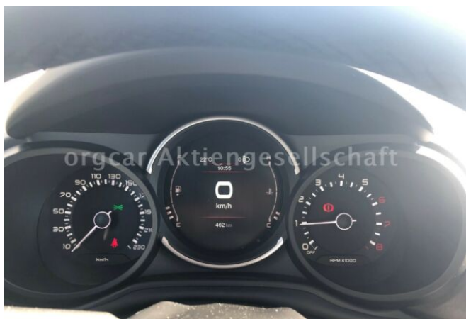
don't buy a car before you try us!