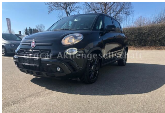
don't buy a car before you try us!