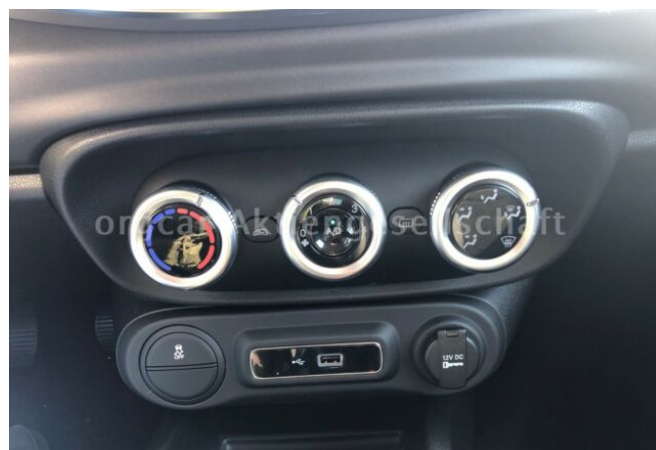
don't buy a car before you try us!